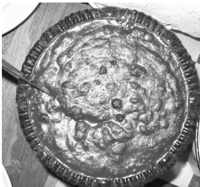
Национальное нивхское блюдо - муви (ноябрь 2003г. с. Некрасовка) Traditional Nivkh dish - Muvi – potato and cranberry purée (November 2003, Nekrasovka) ニヴフの伝統料理 「ムヴィ」 (2003年11月ネクラソフカ)